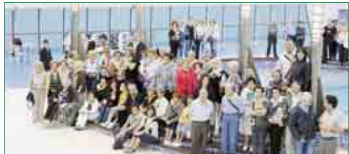
Els pelegrins al vaixell durant el viatge d'anada

Si vàrem escollir aquesta modalitat que a hom pot sorprendre per a un pelegrinatge, va ser perquè dona molt de si per a poder cohesionar el grup durant les 20 hores de trajecte que, naturalment, possibiliten molt més que un altre mitjà conèixer-se, compartir, celebrar, descansar i fruit de la visió relaxant del mar i dels nombrosos serveis de la nau Cruise Roma. L'objectiu es va aconseguir abastament. Realment, tot això, i comptant sobretot amb uns integrants de l'expedició d'alta qualitat humana, va donar un grau tan elevat de bona convivència, harmonia i bon ambient, que es van crear uns lligams tan fermes que ja tothom espera poder compartir de nou altres experiències per l'estil.