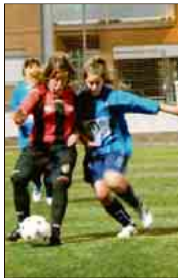
La Mar lluitant per una pilota

La segona part va diferir poc de la primera. Domini del Reus trencat a estones per l'Igualada, que va disposar d'algunes ocasions