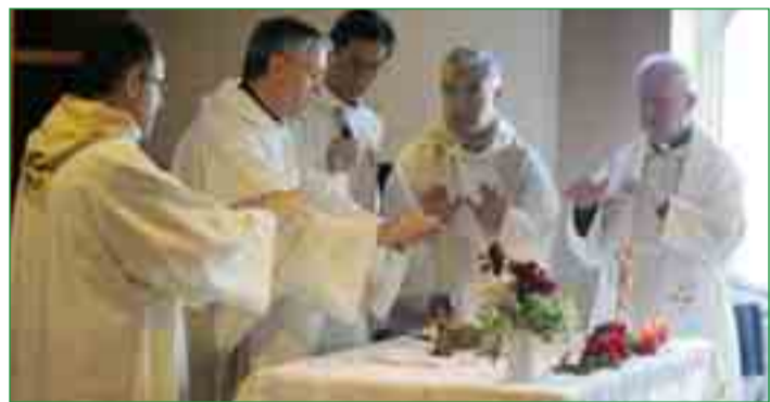
Concelebrants a la missa del divendres dins el vaixell