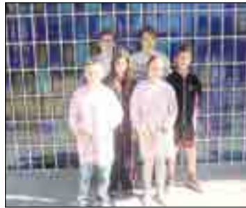
Bon paper a les proves Cangur.

Per finalitzar les activitats relacionades amb l'exposició, la Núria va anar al centre per portar a terme un taller sobre prevenció de conductes de risc mitjançant vídeos, concursos i jocs de rol.