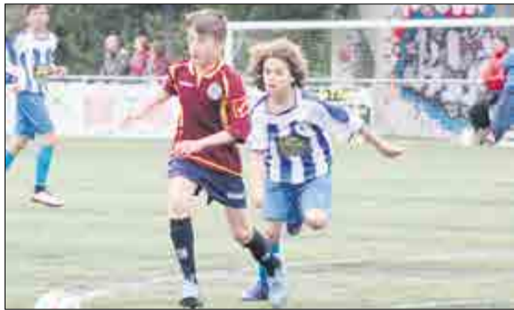
Pau, lateral dret