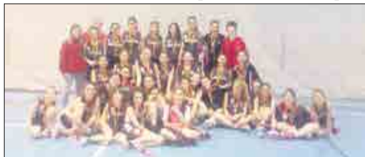
El Monalco, dins el seu Projecte