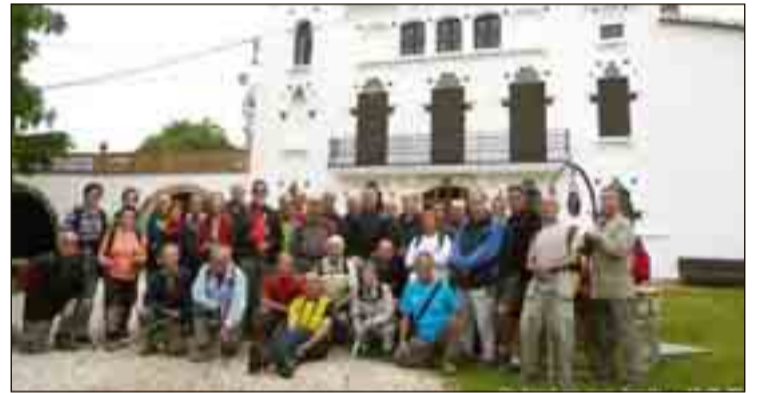
A can Raspall dels Horts

La caminada començà al aparcament de les Caves Naveran, des d'on seguirem la major part dels escenaris exteriors on es filmà els anys 1996-1997 la telenovel·la de TV3 "Nissaga de poder", una història sobre uns importants cavistes (els Montsolís) del Penedès, plena d'intrigues i tripijocs. A un tir de pedra, l'església de Sant Martí Sadevesa, situada al nucli que duu el mateix nom. Es tracta d'una capella construïda al segle XII, tot i que ha sofert moltes transformacions, amb porta dovellada, absis poligonal i campanar d'espaldanya de dos ulls. Ben aviat arribem a la masia de Can Raspall dels Horts que data del 1909 sobre una antiga masia del segle XVII, ubicada enmig d'un paratge de bosc i vinyes. És un exemple plenament modernista principalment en l'estructuració de les façanes. Només traspasar la tanca ens trobem amb un magnífic pati que emmar-