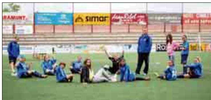
L'equip fent estiraments en acabar el matx

A la represa i al minut vuit de la tercera part, potser la part en