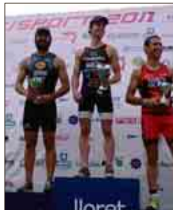
En la classificació per clubs, el CERRR Igualada es va classificar en 5è lloc de 41 equips.