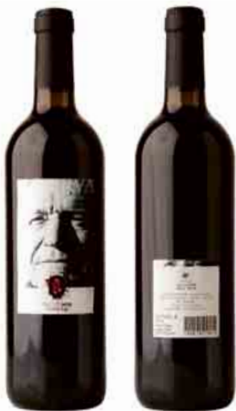
Imatge del projecte final de l'exalumna Sara Gascó