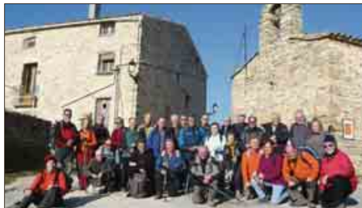
Aturada a Sant Gallard.

La sortida la fem des del cementiri de la vila, on deixem els cotxes en l'ampli aparcament. A primera hora matinal encara do-