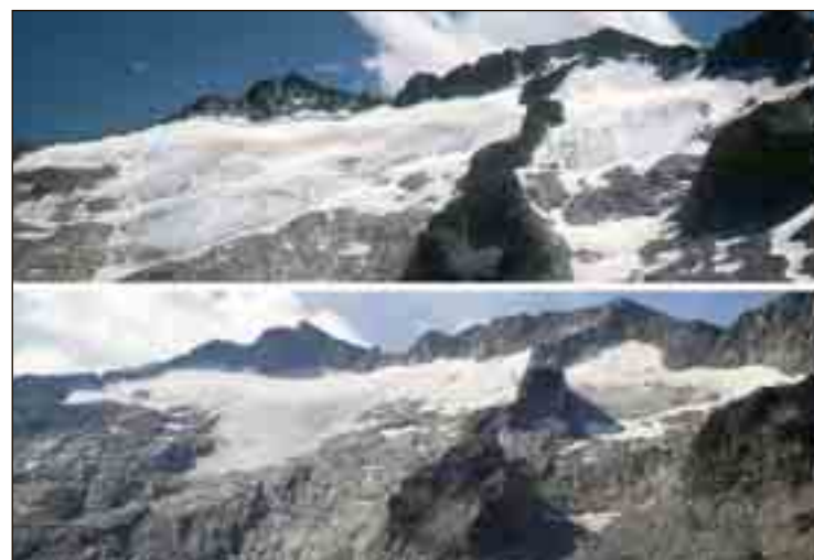
Comparativa de 26 anys (1985-2011) Glacera Oriental i Occidental de la Maladeta