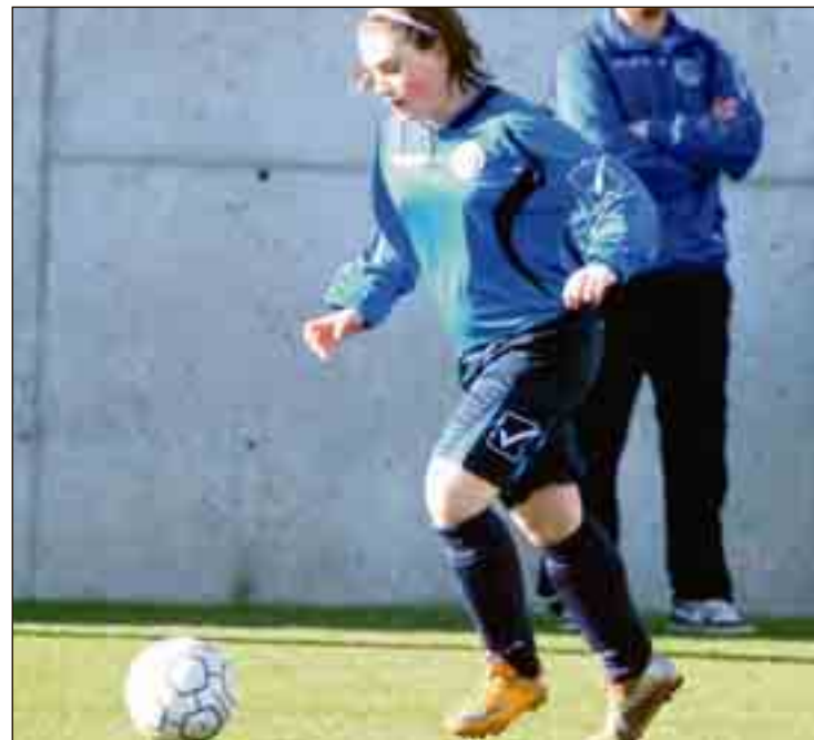
L'Imma corrent per la banda en un moment del partit