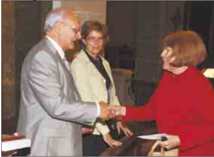
Primer premi de poesia

El passat diumenge, 25 de maig, a la Basílica de Santa Maria, a les 5 de la tarda, es va portar a terme el lliurament de premis del Certamen Literari, com a col·fó dels actes del cinquantenari de l'entitat.