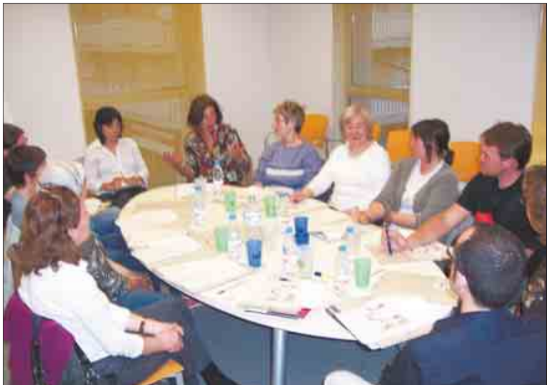
El Nucli Impulsor del PEC es reuneix cada mes.

En paral·lel al NIM i a l'Oficina tècnica, també es crearan diferents grups de treball formats per ciutadans i ciutadanes que van demanar participar en el PEC. Aquests grups, treballaran de forma exclusiva un dels eixos. Hi haurà un grup per cada eix.