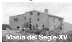
Masia del Segle XV