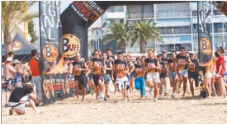
Moment de la sortida a Coma-ruga.

L'empresa igualadina Firalia Esdeveniments, filial de les botigues Marathon Esports, organitzarà el proper any 2007 la Copa d'Espanya de Beach Running. La competició es realitzarà en quatre proves a la Costa de Llevant, Costa del Sol, Cantàbric i finalitzant en una platja catalana de renom, en el que serà la gran festa "Copa Beach Running". Aquesta nova modalitat esportiva, barreja de competició i activitat lúdica, ha