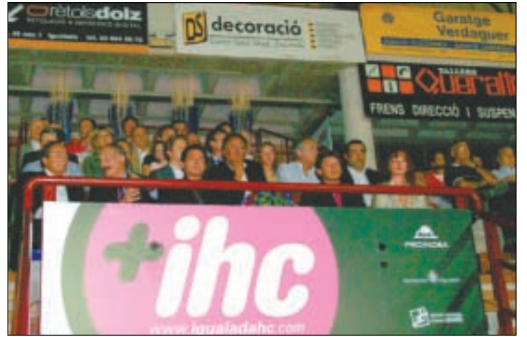
Autoritats i representants dels dos equips a la llotja presidencial