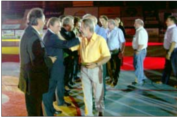
El club va homenatjar jugadors que al seu dia van defensar els colors de l'Igualada